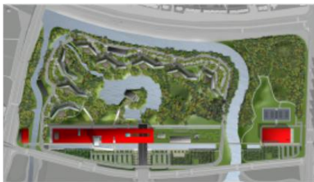
CELAP – Pudong - 2005