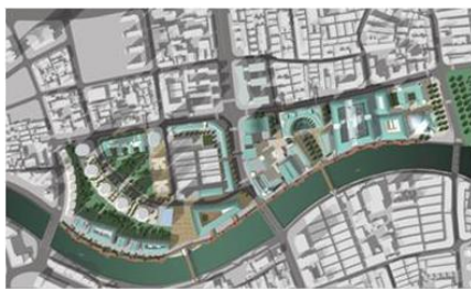
SUZHOU CREEK - 2003