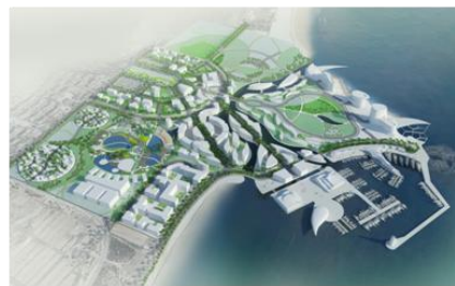
CITE DU CINEMA – QINGDAO - 2012