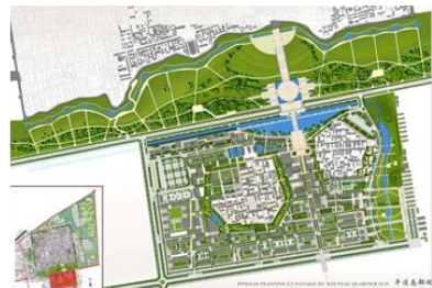
PINGYAO - 2006