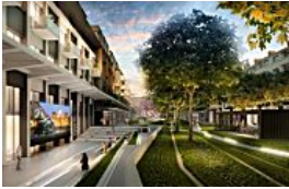
Lyon : le site de la Blanchisserie Centrale reconverti en 255 logements