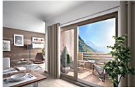
La RT 2012 dans les logements à la montagne, c'est pas encore ça !