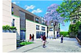
Montmartre : des logements neufs en bois, une première à Paris !